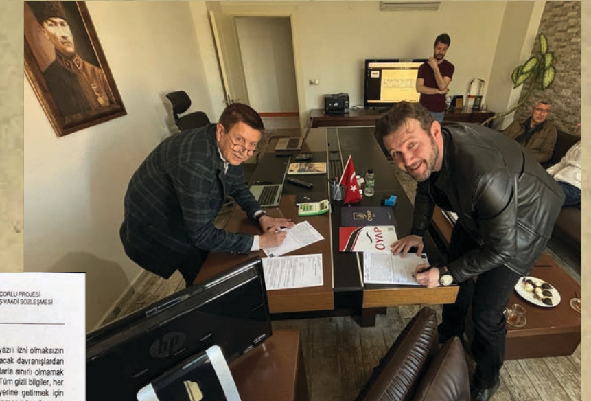
DORLU PROJESİ SVAADI SÖZLEŞMESİ

OYAP Yatırım İnşaat San.Tic.Ltd.Şti. 1071 USTA Plaza, A Blok, No 116, Çukurambar / Çankaya / Ankara İletişim: +90 501 011 1923 / +90 532 500 7322